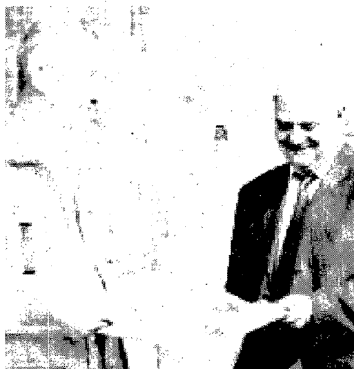
VOLONTARI soccorso Caravino

L'Anpas Comitato Regionale Piemonte rappresenta oggi 82 associazioni di volontariato, 8.637 volontari, 11.179 soci, 329 dipendenti e 185 ragazzi e ragazze in Servizio civile che, con 403 autoambulanze, 91 automezzi per il trasporto disabili e 186 automezzi per il trasporto persone e di protezione civile, svolgono annualmente 370 mila servizi con una percorrenza complessiva di oltre 12 milioni di chilometri.