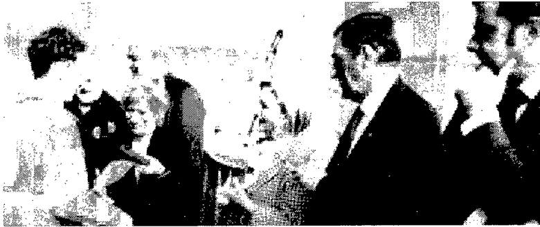
VOLONTARI soccorso Verolengo