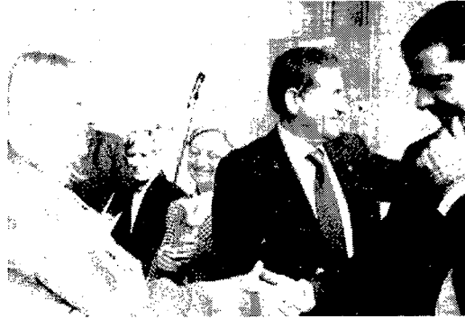
VOLONTARI soccorso San Giusto Canavese