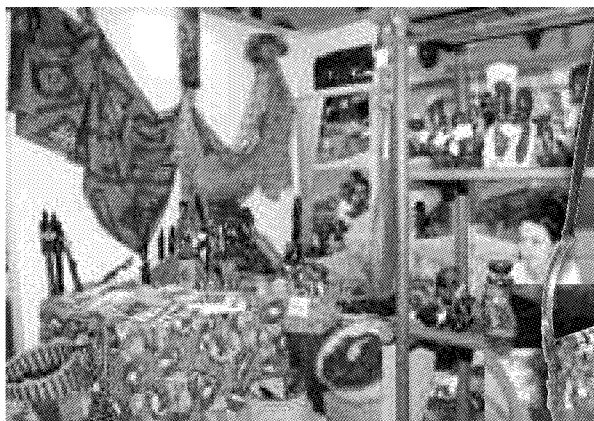
BORSE, ARREDAMENTO E PRODOTTI ALIMENTARI PER VIVERE RISPETTANDO L'AMBIENTE

■ Nella sezione "Agisco" si può trovare tutto l'occorrente per la spesa quotidiana responsabile, ovvero prodotti provenienti da agricoltura biologica o dal commercio equo e solidale, capi di abbigliamento realizzati grazie a materiali riciclati e arredamento (sia per la casa sia per l'ufficio) a basso impatto ambientale. Ecco una selezione degli spazi espositivi presenti nella sezione.