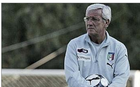
Marcello Lippi, 60 anni, c.t. della Nazionale italiana.

Il c.t. della Nazionale ha accettato di girare per Moni Ovadia in un dvd da distribuire nelle scuole. Tra i testimonial anche Jovanotti e gli attori Albanese e Nicoletta Braschi