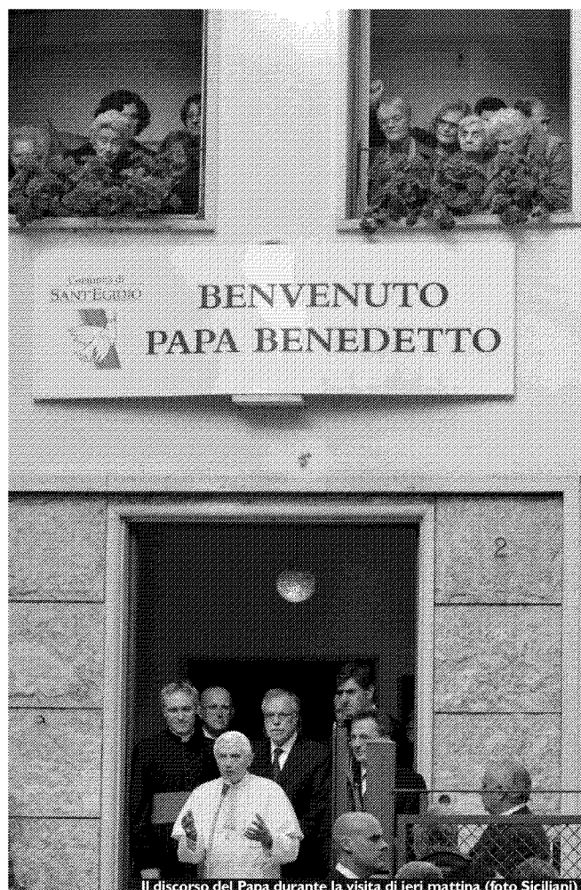
Il discorso del Papa durante la visita di ieri mattina