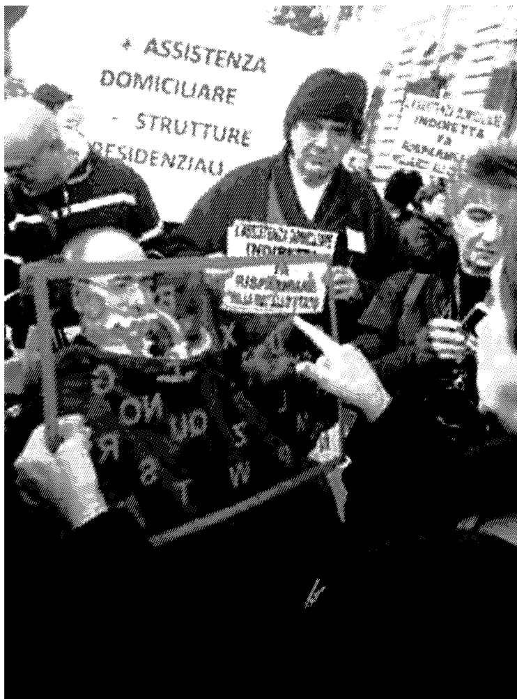
MANIFESTAZIONE A decine in piazza ieri «disposti a tutto»