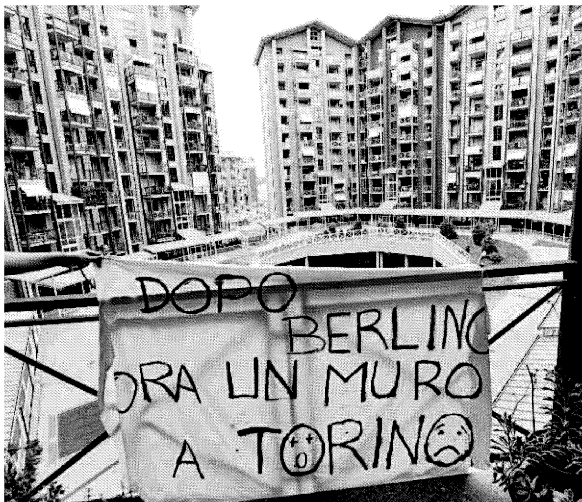
Il Condominio delle case popolari di Corso Rosai 44, a Torino, dove è stata issata una rete per dividere i bambini

Respingimenti e pregiudizi. Viaggio nell'Italia disseminata di recinti, caricature dei veri confini ma con una carica ideologica potentissima. Sono espressione di una cultura politica e sociale che sceglie di allontanare. Così anche i permessi di soggiorno diventano barriere