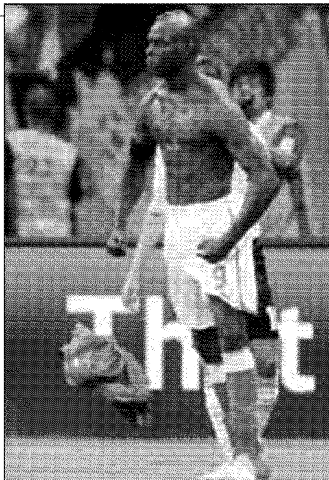
Mario Balotelli si toglie la maglia dopo il secondo gol nella semifinale contro la Germania